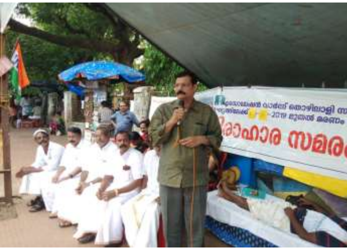
कर्नाटक बीड़ी बंदी व्यपारी संगठन पर्व वाककूट शाखा

बेलगाम: बेलगाम महा नागर पालिका पहचान पत्र जारी करने और वेंडिंग जोन बनाने की मांग को लेकर विरोध प्रदर्शन