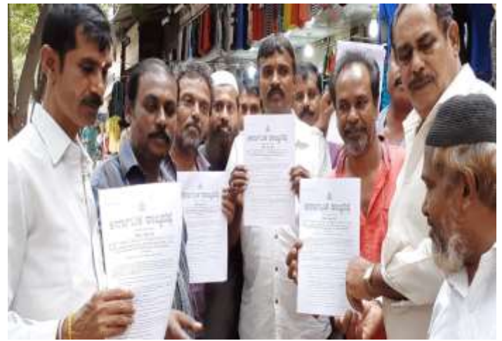
शाहपुर नगर मार्किट, हैदराबाद टीवीसी चेरमैन द्वारा ग्रीन वेंडिंग जोन घोषित किया गया ।

कर्नाटक सरकार द्वारा 24 Jun 2019 को स्ट्रीट वेंडर एक्ट 2014 का गठन किया गया और बेंगलुरु-कर्नाटक में सड़क विक्रेताओं द्वारा इस दिवस को मनाया गया।