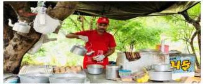
व्यवसाय-ही कल्पे सेइ दुःख: यदीहवाणें या-ही डिटीवी आने दुःख कटीय पाहको इये-नाया पडेइयेकथा खेया भासवी

मसूरी में नासवी के पहल पर टीवीसी का गठन मसूरी क्षेत्रानान्तर्गत नगर पालिका परिषद् क्षेत्र में माल रोड से अतिक्रमण के नाम पर सभी रेहड़ी पटरी व्यवसायियों को नगर पालिका तथा प्रशासन के द्वारा उनकेविक्रयस्थान से हटा दिया गया। शोशल मीडिया पर वाइरल हुए वीडियो के माध्यम से हमें ज्ञात हुआ | मसूरी में स्ट्रीट वेंडर्स की मदद के लिए नासवी ने वस्तु स्थिति का जाएजा लेकर पहल की। वहाँ विभिन्न मार्केट में स्थानीय लीडर्स के साथ जाकर भी मुलाकात की, यहाँ पर मसूरी क्षेत्र अंतर्गत नगर पालिका परिषद् क्षेत्र में 13 वार्ड है जिसमें मुख्यतः मालरोड, वार्डनंबर 8 में वेंडर्स की जनसँख्या सबसे अधिक है, तथा यही पर ज्यादा वेंडर्स को परेशान किया जाता है, यहाँ कुल वेंडर्स से संख्या 400 से 500 है।