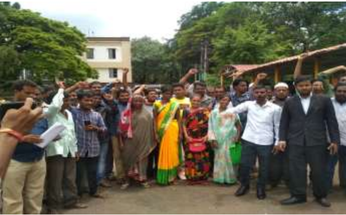
कनाकपर - रामनगर में वेंडिंग जोन का निर्माण

बेलगाम: बेलगाम महा नागर पालिका पहचान पत्र जारी करने और वेंडिंग जोन बनाने की मांग को लेकर विरोध प्रदर्शन